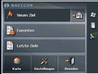
Abbildung des Easy Modus.

Beispiele von Kartendarstellungen des MN|5 auf dem PNA: