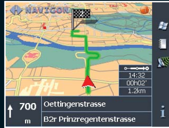
Darstellung einer 3D-Navigation.