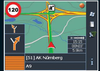
Anzeige einer SpeedInfo.